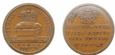
Рис. 2. Жетон на коронацию Екатерины I

К сожалению, трудно что-либо сказать об официальных тиражах медалей и жетонов в память коронации Екатерины I. Можно лишь предположить, что последние были отчеканены в значительно большем количестве, так как разбрасывались допущенному на соборную площадь Кремля народу. Медали, вероятно, раздавались во время торжественного пиршества, как упоминалось, «ближним», в число которых могли входить не только родственники, но и представители высшей знати, русского духовенства, а также иностранные министры, то есть послы. Из этого следует, что медалей могло быть отчеканено несколько сотен, а