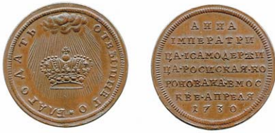
Рис. 5. Жетон на коронацию Анны

Более чем скромный серебряный жетон диаметром 23 мм на аверсе имел изображение императорской короны, освящаемой сиянием, исходящим из облака и соответствующую надпись: «БЛАГОДАТЬ ОТ ВЫШНЕГО». Обрат содержал более пространную семистрочную легенду: « АННА / ИМПЕРАТРИ / ЦА И САМОДЕРЖИ / ЦА РОССИЙСКАЯ КО / РОНОВАНА В МОСК / ВЕ АПРЕЛЯ / 1730». По-видимому, учитывая простоту композиции жетона, его авторство правомерно приписать какому-либо из русских мастеров (рис. 5).