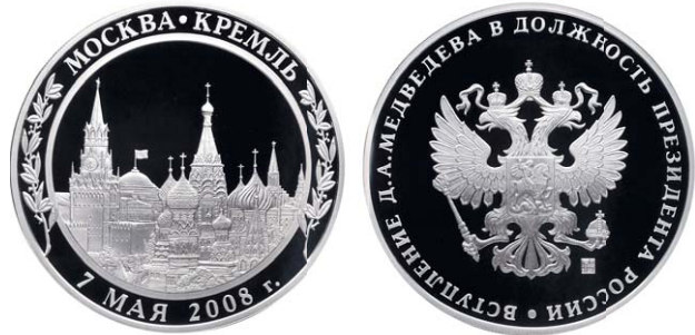
Инаугурационная медаль (d=50 mm, вес = 2 унции, серебро 925 пробы). Редакция благодарит Управление Протокола Президента Российской Федерации за предоставленную для публикации медаль.

7 мая 2008 года Дмитрий Медведев официально вступил в должность Президента Российской Федерации. Помимо протокольных тонкостей этого мероприятия, строго исполненных под наблюдением Государственного герольдмейстера, приглашенные на инаугурацию гости получили в память об этом дне специальную медаль. С уверенностью можно сказать, что этот нумизматический памятник попадет в разряд раритетов: тираж медали составил всего 2700 экземпляров — по числу присутствовавших гостей, которые вряд ли согласятся расстаться с ней. Даже за большие деньги!