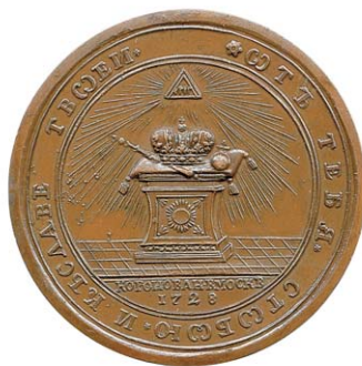
Рис. 3. Медаль на коронацию Петра II