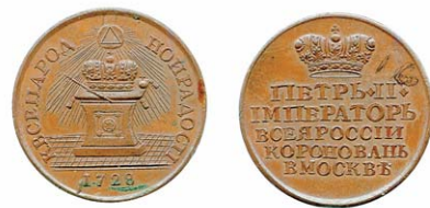
Рис. 4. Жетон на коронацию Петра II

Несколько видоизменился и жетон. Аверс: под императорской короной помещена надпись в пять строк — «ПЕТРЪ II / ИМПЕРАТОРЪ / ВСЕЯ РОССИИ / КОРОНОВАНЪ / В МОСКВЕ». На обороте изображен постамент с регалиями, лежащими на подушке, и декларативное заявление верноподанным: «К ВСЕНАРОДНОЙ РАДОСТИ». К сожалению, и в данном случае мы не можем указать конкретные тиражи медалей и жетонов, отчеканенных по случаю