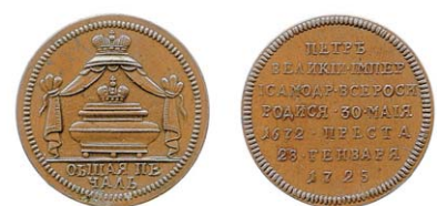
Рис. 1. Жетон на смерть Петра I

С этого времени начинает складываться тип оформления коронационных медалей и жетонов в России. На аверсе медали изображены погрудные портреты Петра и Екатерины с круговой надписью «ПЕТРЪ ИМПЕРАТОРЪ ЕКАТЕРИНА ИМПЕРАТРИЦА». Обратная сторона имела более сложную компози-