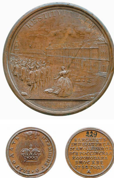
Рис. 6. Медаль «Елизавета предводительствует гвардейцами» и жетон на коронацию Елизаветы

Все последующие коронационные торжества в России неизменно сопровождались выпуском специальных медалей и жетонов, а также памятных монет и даже наградных медалей, чего ранее не случалось. Впервые это произошло в 1883 году, когда на русский трон возшел Александр III. 112 тысяч медалей и более 270 тысяч рублевых монет предназначались для награждения и раздачи лицам, принимавшим участие в коронации 15 мая 1883 года. Интересен следующий факт. Новый император лично утвердил эскиз наградной медали спустя некоторое время, так сказать, задним числом.