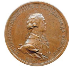
Рис. 7. Коронационная медаль Павла I

Единственным императором, который не успел короноваться, был Петр III, свергнутый собственной супругой, взшедшей на российский престол под именем Екатерины II. Примечательно, что с момента фактического захвата власти в конце июня 1762 года до коронации Екатерины прошло менее трех месяцев: так спешила новая императрица официально узаконить свое положение. В собрании Мюнцкабинета имеются две медали, посвященные событиям 1762 года. Первая отчеканена по случаю вступления на престол Екатерины II 28 июня, вторая в память коронации, которая состоялась 22 сентября 1762 года. Композиция обеих медалей создана Иоганном Георгом Вехтером, братом упомянутого выше художника, поступившим на русскую службу в 1762 году. И вновь перед нами предстают многофигурные аллегорические картины, подробное описание которых занимает около целой страницы типографского текста! Екатерина оказалась и са-