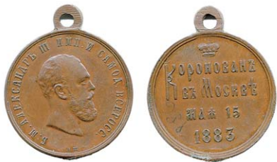
Рис. 8. Наградная коронационная медаль Александра III

При этом, если рубли чеканились из серебра, то медали были бронзовыми, для ношения на красной ленте ордена св. Александра Невского, из чего следует, что основной массой награжденных являлись нижние военные чины подразделений, приведенных на торжества в Кремль (рис. 8).