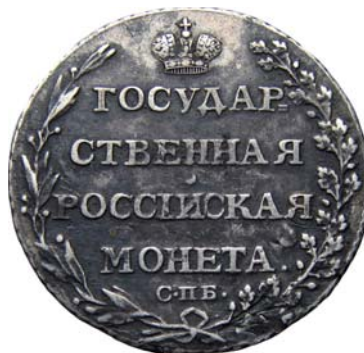
увеличено в 2 раза