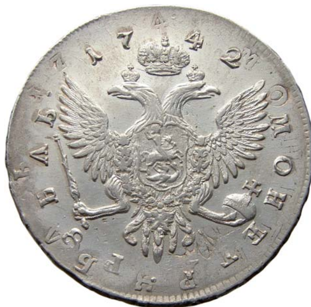
увеличено в 2 раза