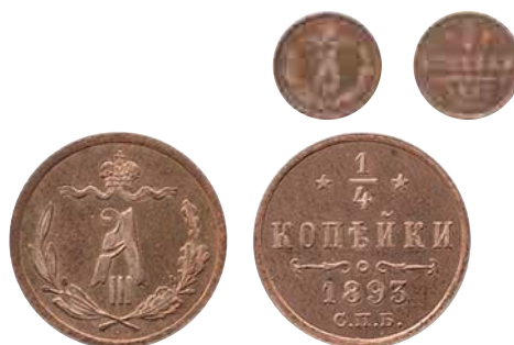
увеличено в 2 раза