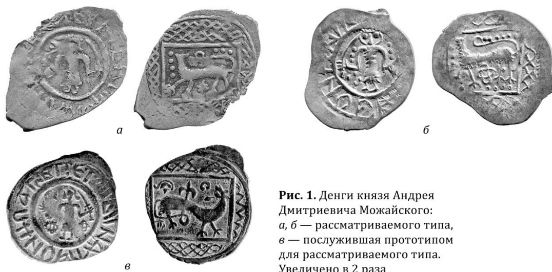
Рис. 1. Денги князя Андрея Дмитриевича Можайского: а, б — рассматриваемого типа, в — послужившая прототипом для рассматриваемого типа. Увеличено в 2 раза