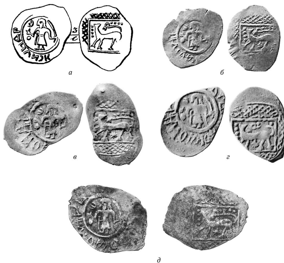
Рис. 2. Денги рассматриваемого типа: а — опубликована в работе А.Д. Черткова; б — эта же, опубликована в работе А.В. Орешникова; в — из коллекции Э.К. Гуттен-Чапского; г — из Рузского клада, описана И.И. Толстым; д — из частной коллекции, опубликована в издании Д.В. Гулецкого и К.М. Петрунина. Увеличено в 2 раза