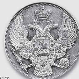
Лот № 159